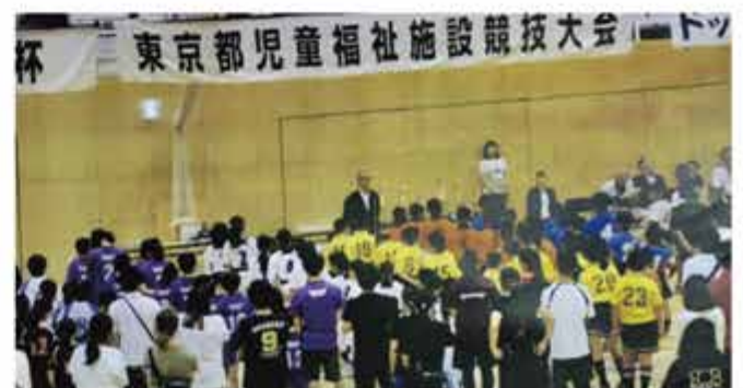
江戸っ子杯表彰式(墨田区総合体育館)

真剣な眼差しでスポーツを楽しむ子供たちのために、今後とも支援を継続して参ります。